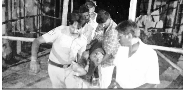
ஏகாம்பரநாதர் கோவில் ராஜகோபுரத்தில் ஏறிய வாலிபர தீயணைப்பு வீரர்கள் மீட்டு வந்த காட்சி.

இதையடுத்து மாணவி தனது கணினி மூலம் இன்ஸ்டாகிராமில் இருந்து நீக்காமல் போக்குகிறார். இதுபற்றி கேட்டபோது எனக்கு மேலும் ரூ.50 ஆயிரம் பணம் வேண்டும். அப்போதுதான் உனது போட்டோக்களை நீக்குவேன் என்று கூறி மீண்டும் மிரட்டல் விடுத்துள்ளார். இதையடுத்து தீயணைப்பு வீரர்கள் மீட்டனர்.