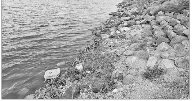
செம்பரம்பாக்கம் ஏரியில் சேதமடைந்த கரையை படத்தில் காணலாம்.