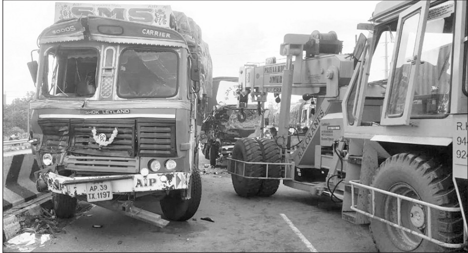
விபத்தில் சிக்கிய லாரிகளை படத்தில் காணலாம்.